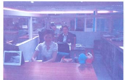
สหกรณ์ฯ มท ปรับปรุงสำนักงานใหม่ เพื่อบริการสมาชิกทุกท่าน