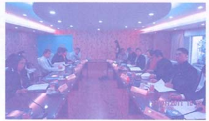
การประชุมคณะกรรมการดำเนินการฯ เมื่อวันที่ 27 มกราคม 2554