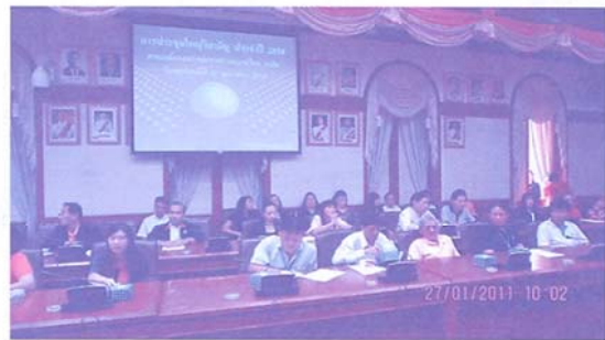
การประชุมใหญ่สามัญ ประจำปี 2554 เมื่อวันที่ 27 มกราคม 2554